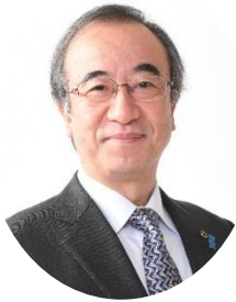
新潟県知事 花角 英世

消費生活サポーターの皆様方におかれましては、日頃から地域における身近なサポーターとして、消費生活に関する知識の普及や啓発活動にご尽力いただき感謝申し上げます。