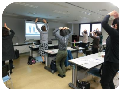
消費者被害防止サポーターが活動で活用している「188体操」を体験