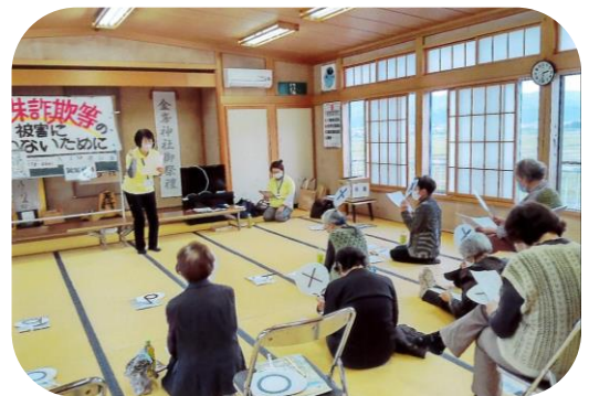
啓発講座（南魚沼市・わらび会）