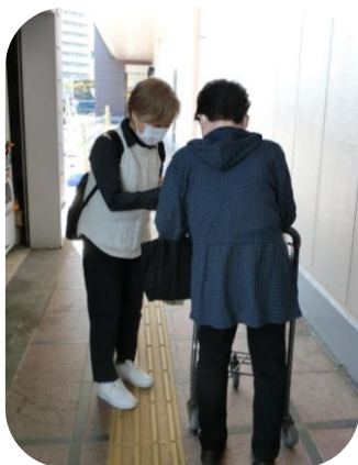
商業施設での啓発活動

10月の年金支給日に合わせ、県内一斉にチラシ配布等の啓発活動を実施しました。今年で2年目、銀行や商業施設等でのチラシ配布や町内回覧、イベントでの配付など、警察や地域の方との協力体制が広がってきました。