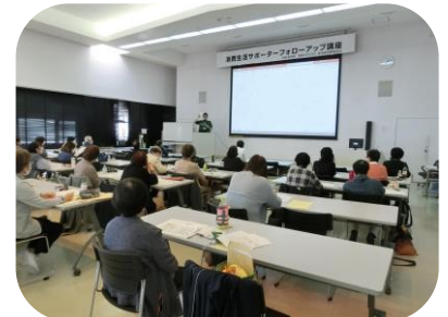
セブンイレブンでの詐欺被害防止への取組について