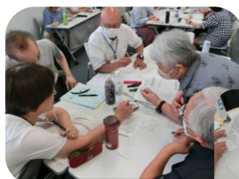
グループで話し合い