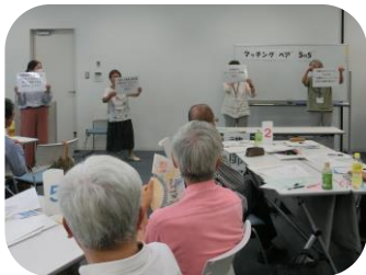
最初にゲームをしてリラックス