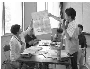
フォローアップ講座 グループワーク