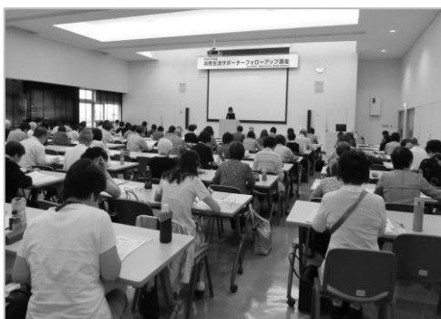
フォローアップ講座 講義