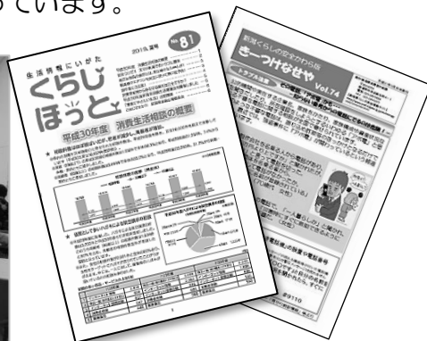
消費生活の情報誌(新潟県発行)