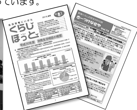
消費生活の情報誌(新潟県発行)