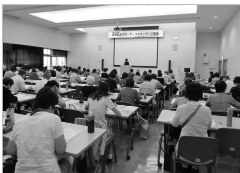
フォローアップ講座 講義